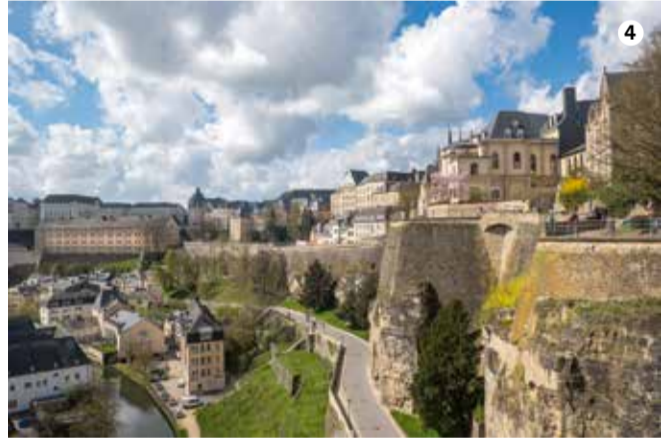
1 Heilig Geist Zitadelle 2 Parkanlage im Petrusstal 3 Stadtpark 4 Stadtwall Corniche

LE GOUVERNEMENT DU GRAND-DUCHÉ DE LUXEMBOURG Ministère de la Culture